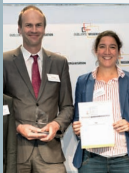
EWO 2012: dsn, Kiel

Wissen vermehrt sich, wenn es geteilt wird!