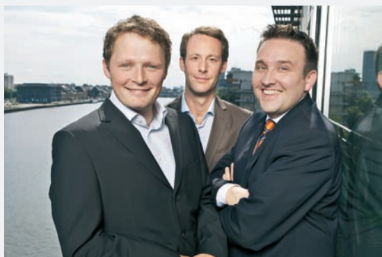
EWO 2009: different GmbH