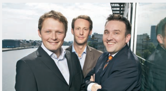
EWO 2009: different GmbH

Der Award bietet all jenen Organisationen eine Präsentationsplattform, welche die Bedeutung guter Wissensorganisation für sich erkannt haben und die eigene Exzellenz beim Umgang mit Wissen nach außen tragen wollen.