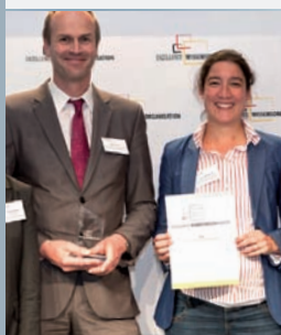
EWO 2012: dsn, Kiel

WISSEN VERMEHRT SICH, WENN ES GETEILT WIRD!